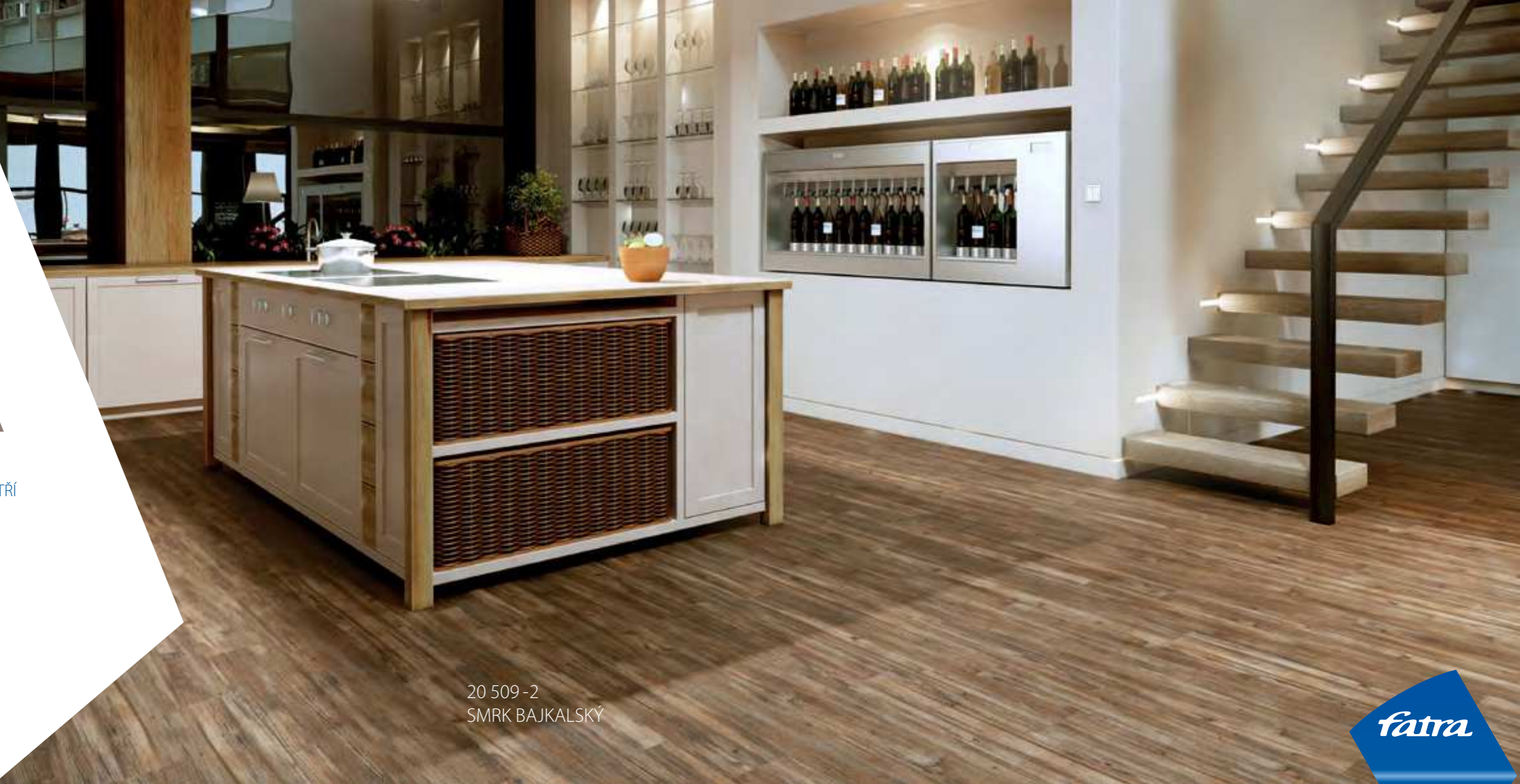
20 509 -2 SMRK BAJKALSKÝ