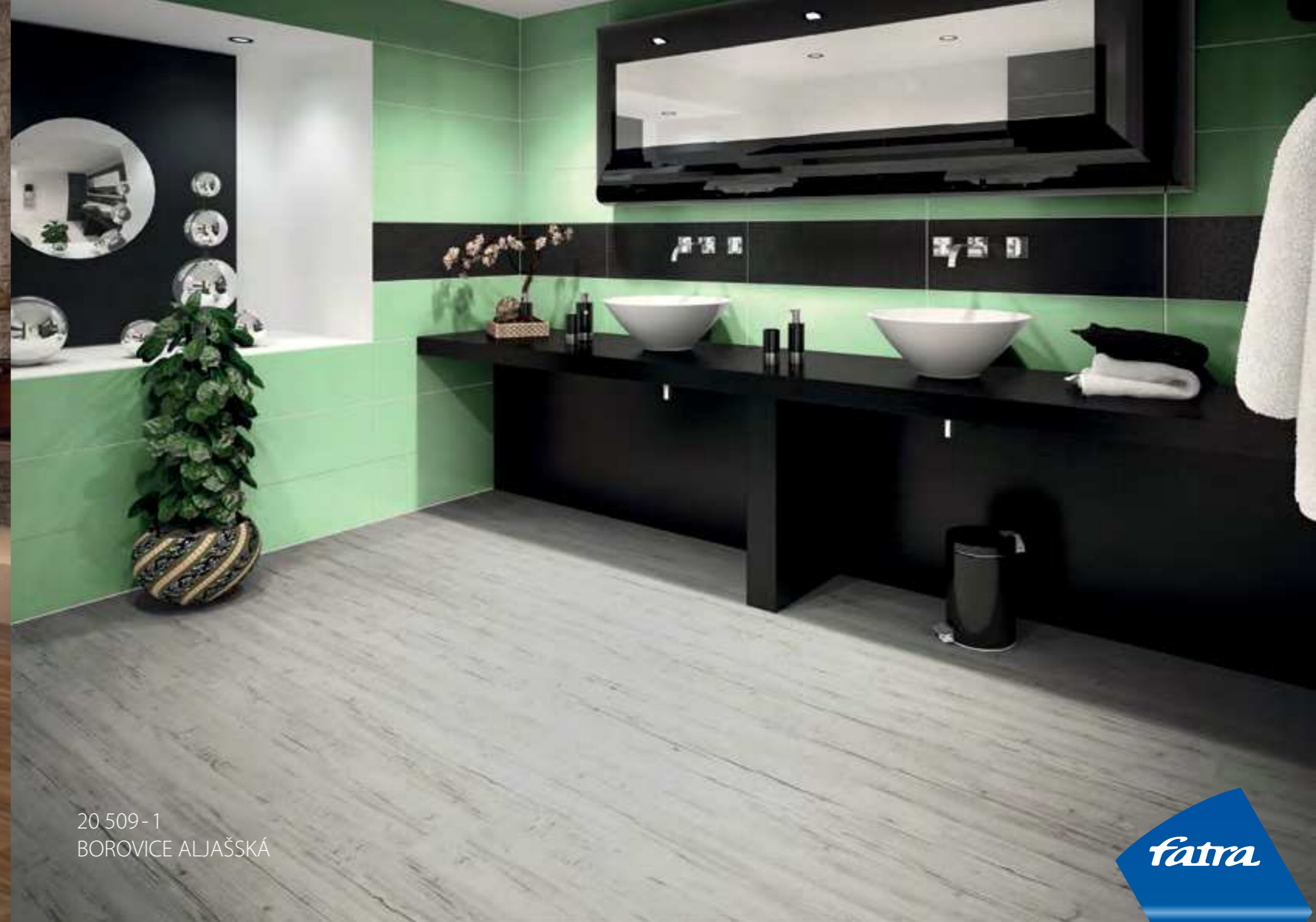
20 509 - 1 BOROVICE ALJAŠSKÁ