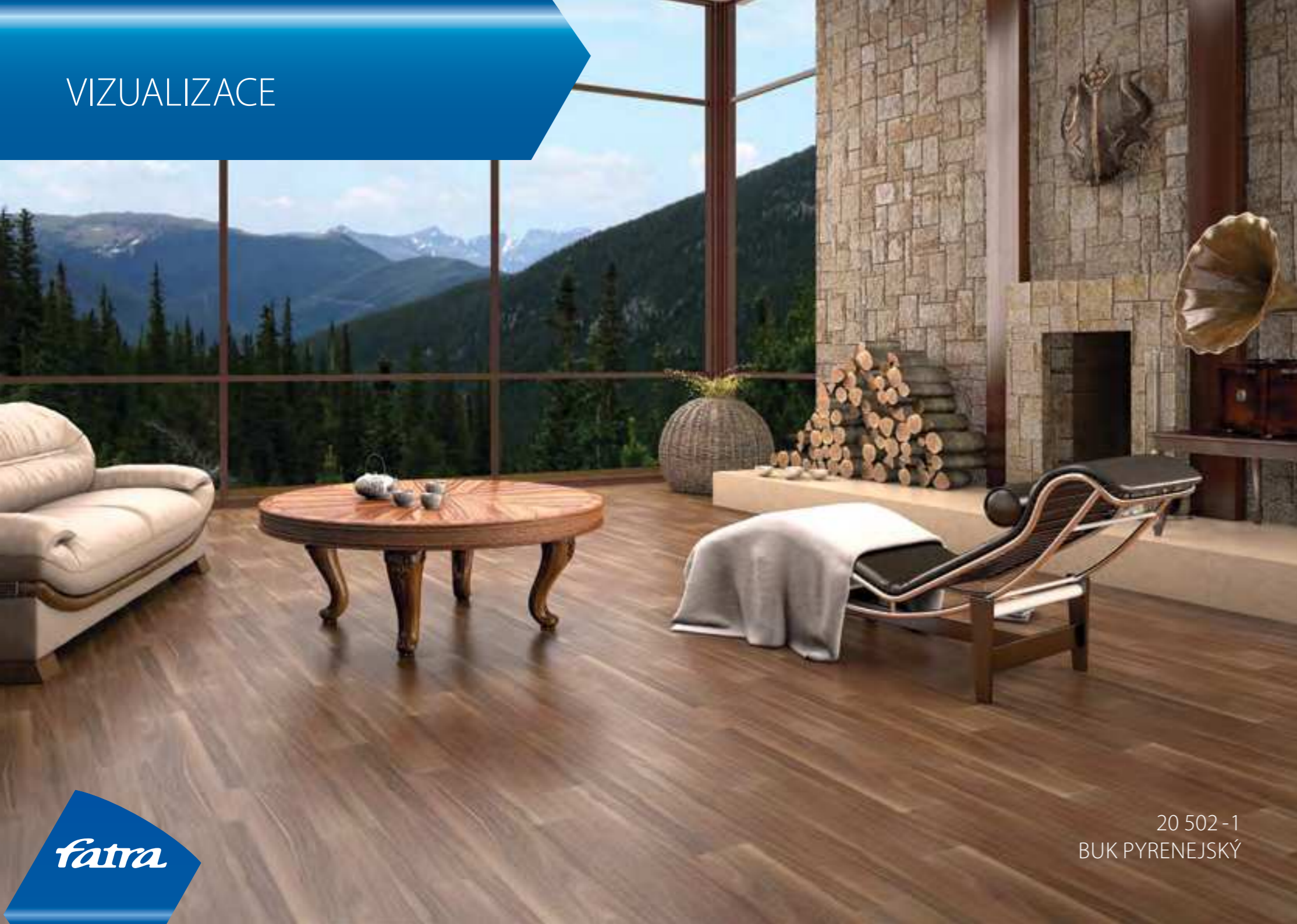
20 502 - 1 BUK PYRENEJSKÝ