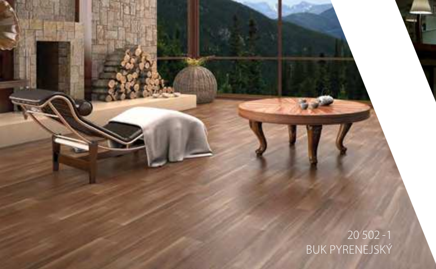
20 502 -1 BUK PYRENEJSKÝ